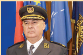
general-pukovnik Mate Pađen, zapovjednik HVU-a

Poštovani čitatelji, ovim vodičem želimo vam predstaviti Hrvatsko vojno učilište kao središnju vojnoobrazovnu ustanovu Oružanih snaga Republike Hrvatske nastalu na samom početku Domovinskog rata. Tijekom godina razvoja programi za obrazovanje časnika i dočasnika mijenjali su se i prilagođavali novim potrebama. U ovoj je obrazovnoj ustanovi dio svog znanja i sposobnosti steklo više od 42 000 pripadnika Oružanih snaga, od vojnika, dočasnika i časnika do generala. Nakon provedenog preustroja Oružanih snaga Republike Hrvatske, ulaska Republike Hrvatske u punopravno članstvo NATO saveza i ulaska u Europsku uniju, Hrvatsko vojno učilište pred novim je izazovima. Akreditiranjem preddiplomskih i diplomskih sveučilišnih studijskih programa i razvojem cjelokupnih obrazovnih programa i sadržaja namjera nam je podići kvalitetu osposobljavanja časnika i dočasnika Oružanih snaga Republike Hrvatske te tako postati poznata i priznata vojnoobrazovna ustanova u zemlji i inozemstvu.