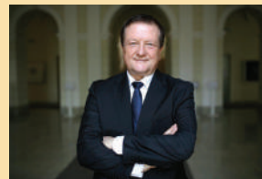
prof. dr. sc. Damir Bonas, rektor Sveučilišta u Zagrebu

Republike Hrvatske, a uz veliku potporu Ministarstva obrane Republike Hrvatske, uspjeli smo uspostaviti dva studijska programa koja su prepoznali maturanti diljem Hrvatske. O njihovoj kvaliteti i atraktivnosti svjedoči i podatak da je upisna kvota na svakom od tih programa popunjena izvrsnim kandidatima te da je zanimanje maturanata za upis na njih vrlo velik. Suradnjom Sveučilišta u Zagrebu, kao najvećega i najstarijega sveučilišta u Republici Hrvatskoj te Hrvatskoga vojnoga učilišta kao središnje visokoobrazovne ustanove Oružanih snaga RH uspostavili smo dva nova integrirana civilno-vojna programa, koji se svojom kvalitetom mogu mjeriti sa sličnim vrhunskim studijima u inozemstvu. Izvrsnosti tih dvaju studija svakako doprinosi i činjenica da u njihovu izvođenju sudjeluje velik broj nastavnika i stručnjaka iz raznih znanstvenih područja, polja i grana, što im daje dodatnu interdisciplinarnu vrijednost. Uprava Sveučilišta u Zagrebu i dalje snažno potiče suradnju s Hrvatskim vojnim učilištem koja je primjer sinergijskoga djelovanja partnerskih institucija u Republici Hrvatskoj.