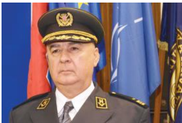
general-pukovnik Mate Pađen, zapovjednik HVU-a

Poštovani čitatelji, Hrvatsko vojno učilište „Dr. Franjo Tuđman” središnja je vojnoobrazovna ustanova Oružanih snaga Republike Hrvatske, čija je glavna zadaća školovanje i osposobljavanje hrvatskih časnika i dočasnika za provođenje složenih vojnih zadaća u zemlji i inozemstvu. Iako se sustav vojnog školovanja kontinuirano razvijao od Domovinskog rata, s ulaskom Republike Hrvatske u NATO i Europsku uniju vojno se školovanje trebalo prilagoditi novim sigurnosnim potrebama i izazovima. Zbog toga se, u suradnji s akademskom zajednicom, započelo s razvojem sveučilišnih studijskih programa oblikovanih za potrebe Ministarstva obrane i Oružanih snaga RH. Od akademske godine 2014./2015. na Hrvatskom vojnom učilištu izvode se preddiplomski sveučilišni studiji Vojno vođenje i upravljanje i Vojno inženjerstvo, a od akademske godine 2018./2019. izvodi se integrirani preddiplomski i diplomski sveučilišni studij Vojno pomorstvo. To je nastavak razvoja visokoškolskog vojnog obrazovanja, koje će budućim časnicima Oružanih snaga Republike Hrvatske omogućiti stjecanje svih potrebnih znanja, vještina i kompetencija sukladno važećim međunarodnim normama i NATO standardima.